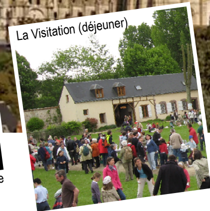
La Visitation (déjeuner)