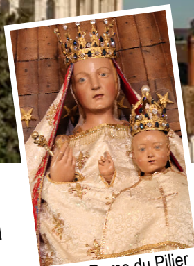
Notre-Dame du Pilier